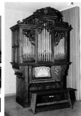
École de Musique