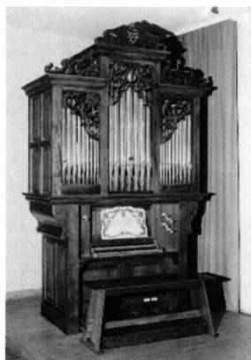
École de Musique