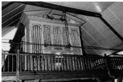
Église Saint-Joseph des Forges